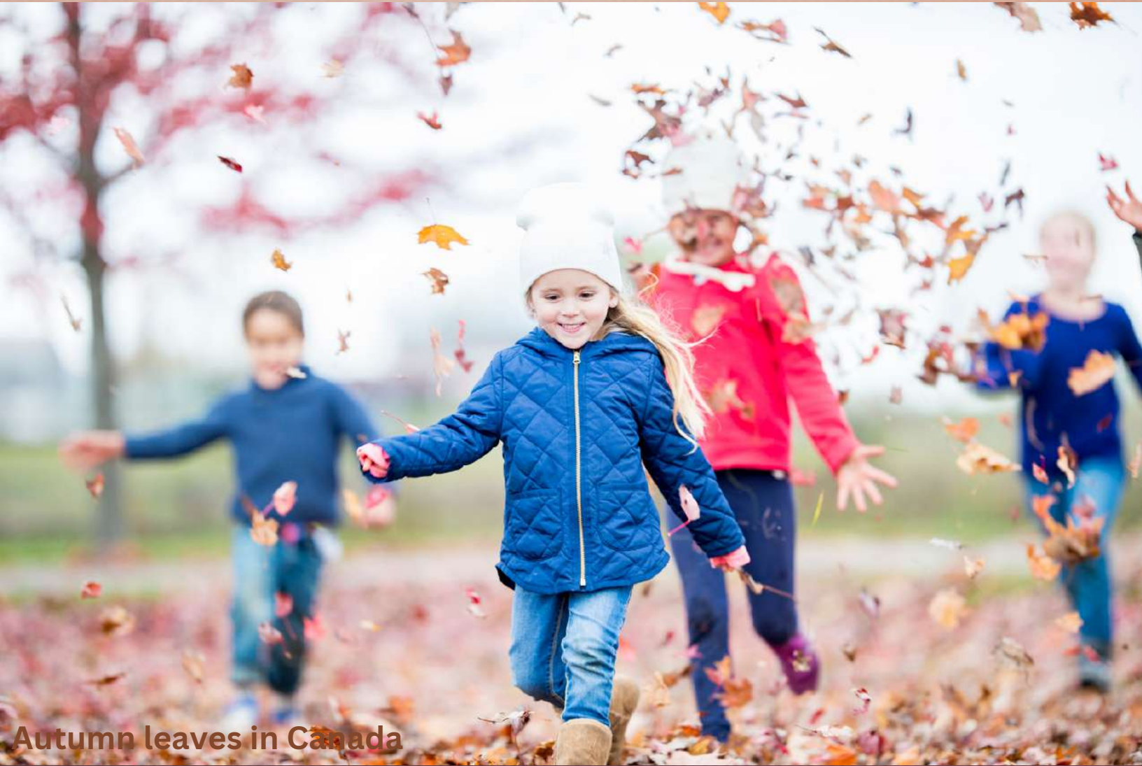
Autumn leaves in Canada

Arabic English French Variety Magazine Magazine de variétés arabe anglais français OCTOBER 2023 ISSUE 72 OCTOBRE 2023 NUMERO 72